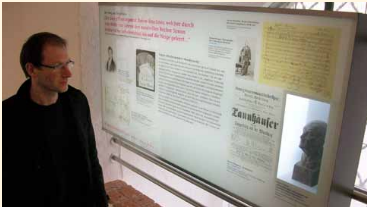
Eine Station der Brucknerstiege zur Orgel des Alten Doms.

Zurück zum Leben Bruckners in Linz. Wie erwähnt wohnte er im Musikantenstöckl und seine Schwester Nani führte