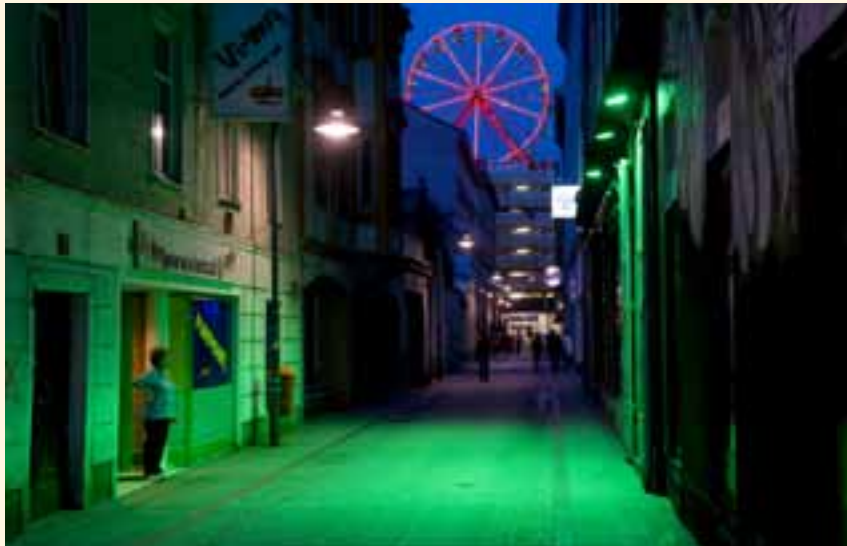
Jens Sundheim, Ohne Titel , aus der Serie Reflecting City , 2009.