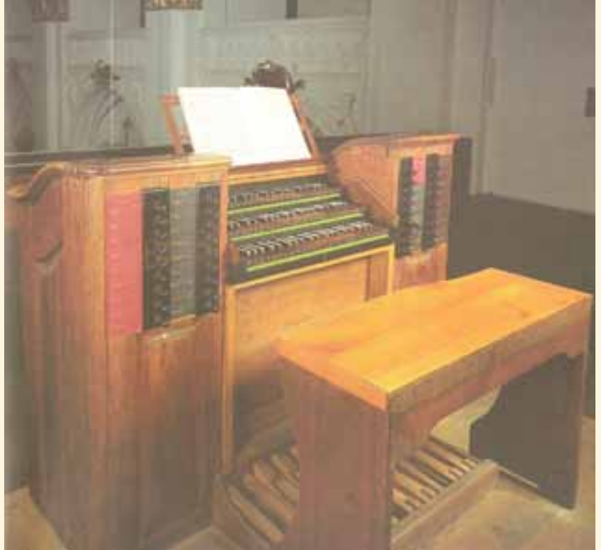
Der Spieltisch der Brucknerorgel.