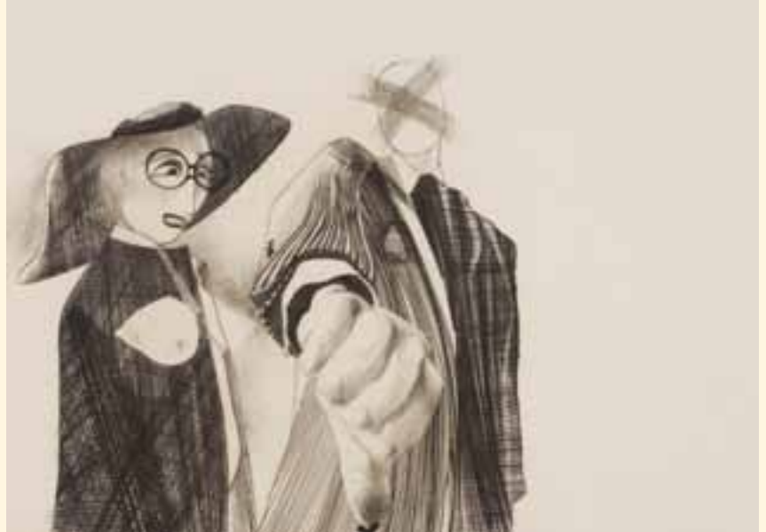
Elfriede Trautner, Das Mal, 1966.

„Die Kunst von Weibern mit roten Fingernägeln und grünen Lidschatten