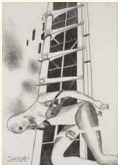
Elfriede Trautner, Ergebenheit , 1983.

Um ihr Können sukzessive zu verbessern, nahm sie 1958, 1959 und 1964 an der Sommerakademie in Salzburg