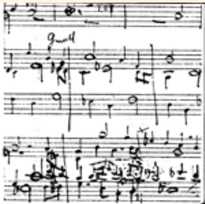
Ein erhaltenes Notenblatt von Anton Bruckner.

Ein besonderes Verhältnis entwickelte Anton Bruckner zur Orgel im Alten Dom, der heutigen „Brucknerorgel“.