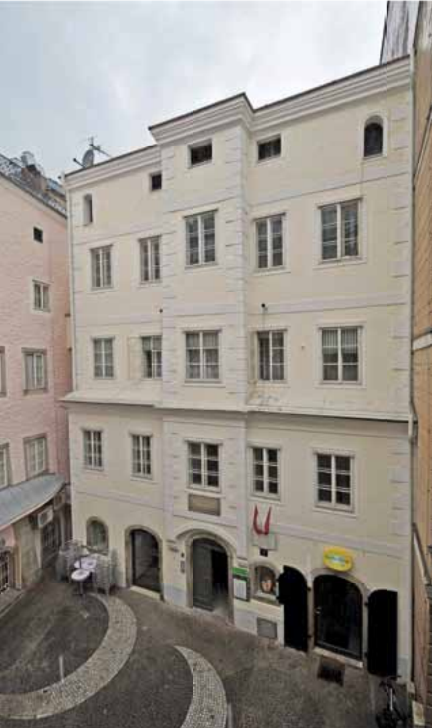
Im Kepler Salon (oben) des Kepler-Hauses finden vor den Workshops themenspezifische Vorträge mit namhaften ReferentInnen statt.